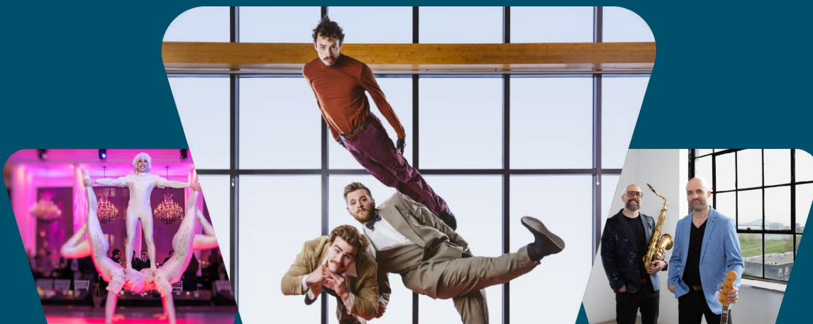
Cocktail : Les Triplettes